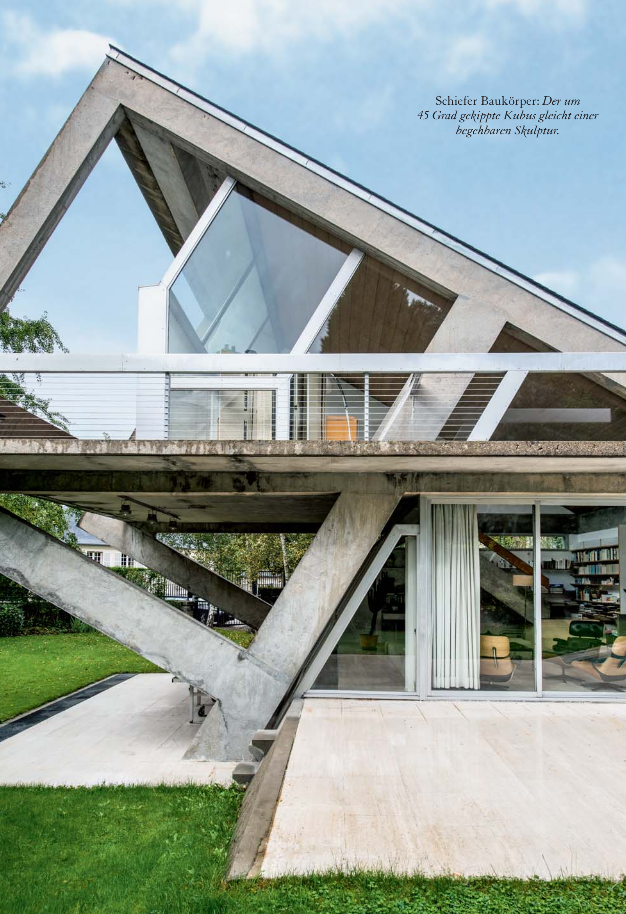
Schiefer Baukörper: Der um 45 Grad gekippte Kubus gleicht einer begehbaren Skulptur.