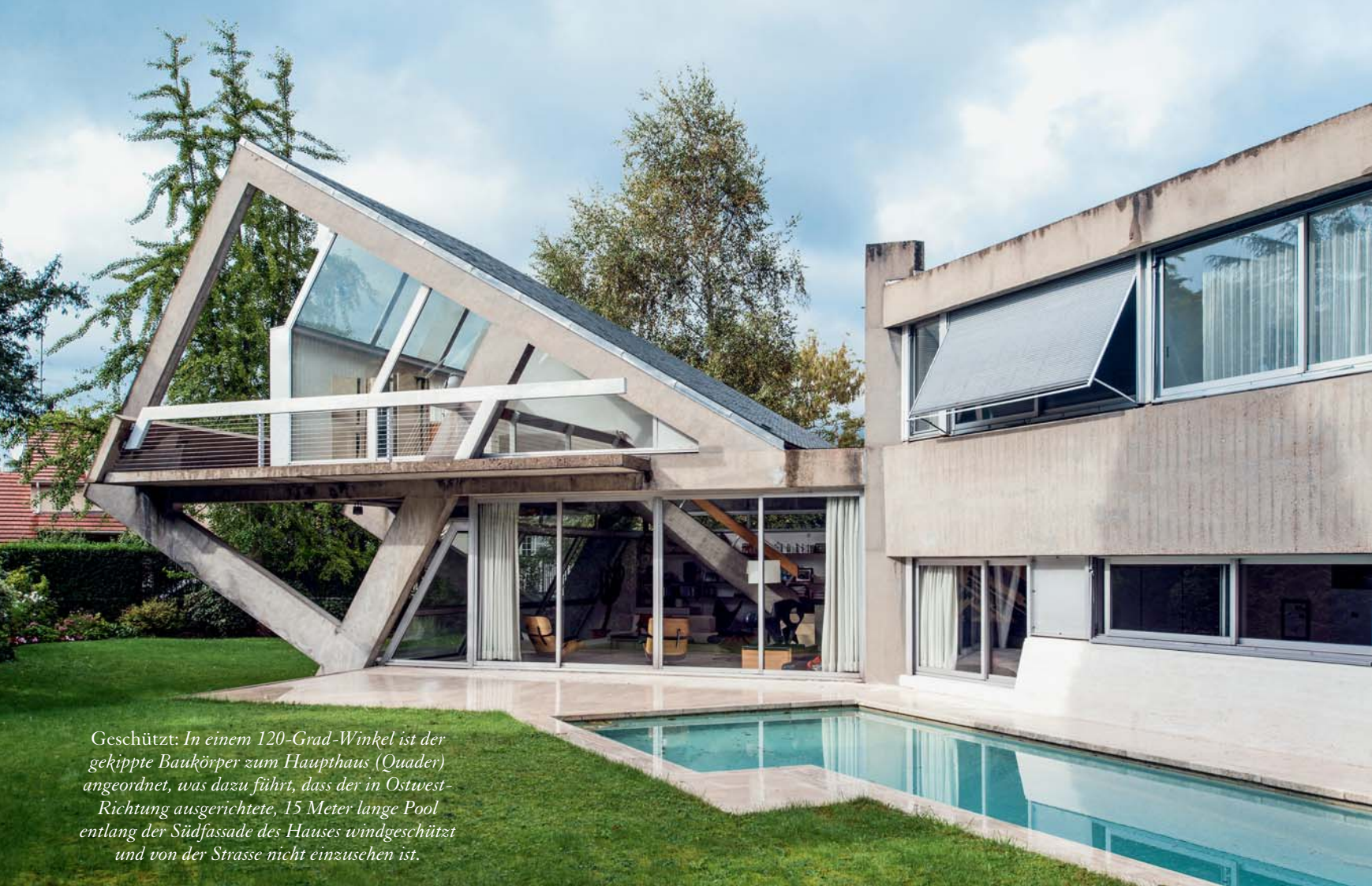
Geschützt: In einem 120-Grad-Winkel ist der gekippte Baukörper zum Haupthaus (Quader) angeordnet, was dazu führt, dass der in Ostwest-Richtung ausgerichtete, 15 Meter lange Pool entlang der Südfassade des Hauses windgeschützt und von der Strasse nicht einzusehen ist.

Geschwindigkeit, Aufbruch, Dynamik, die Idee der Auflösung von Masse und die damit verbundene Vorstellung von Freiheit sind die Motive, die Claude Parents Schaffen als Architekt bestimmten.