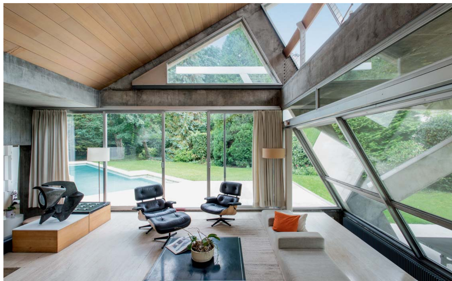
Eingefrorene Bewegung: Die schrägen Wände dynamisieren den Raum. (Skulpturen von Gérard Mannoni)