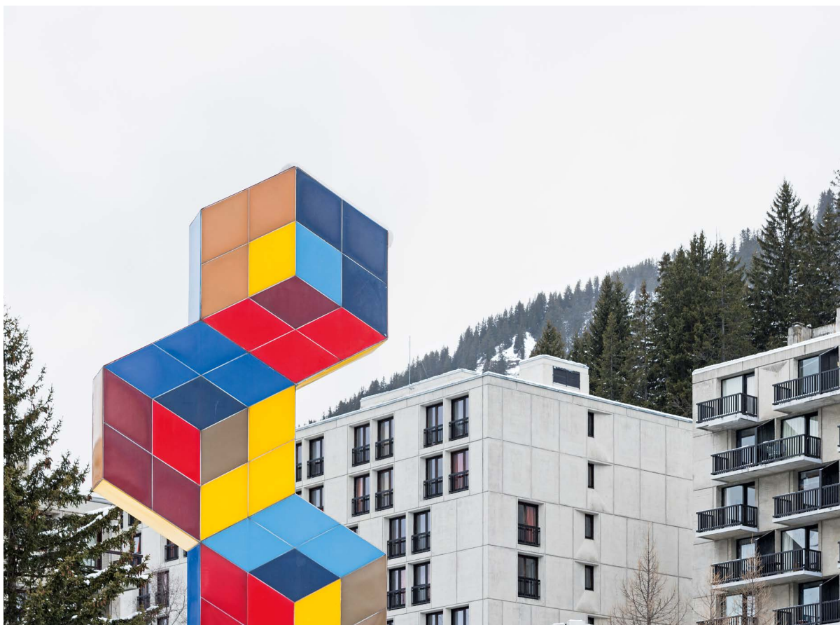
Primo piano su 'Three Hexagons', opera di Victor Vasarely del 1973, parte dell'insieme di installazioni site specific del Flaine Art Center (oggi Centro Culturale Flaine) che dagli anni '70 riunisce arte e architettura nel contesto naturale del paesaggio alpino.