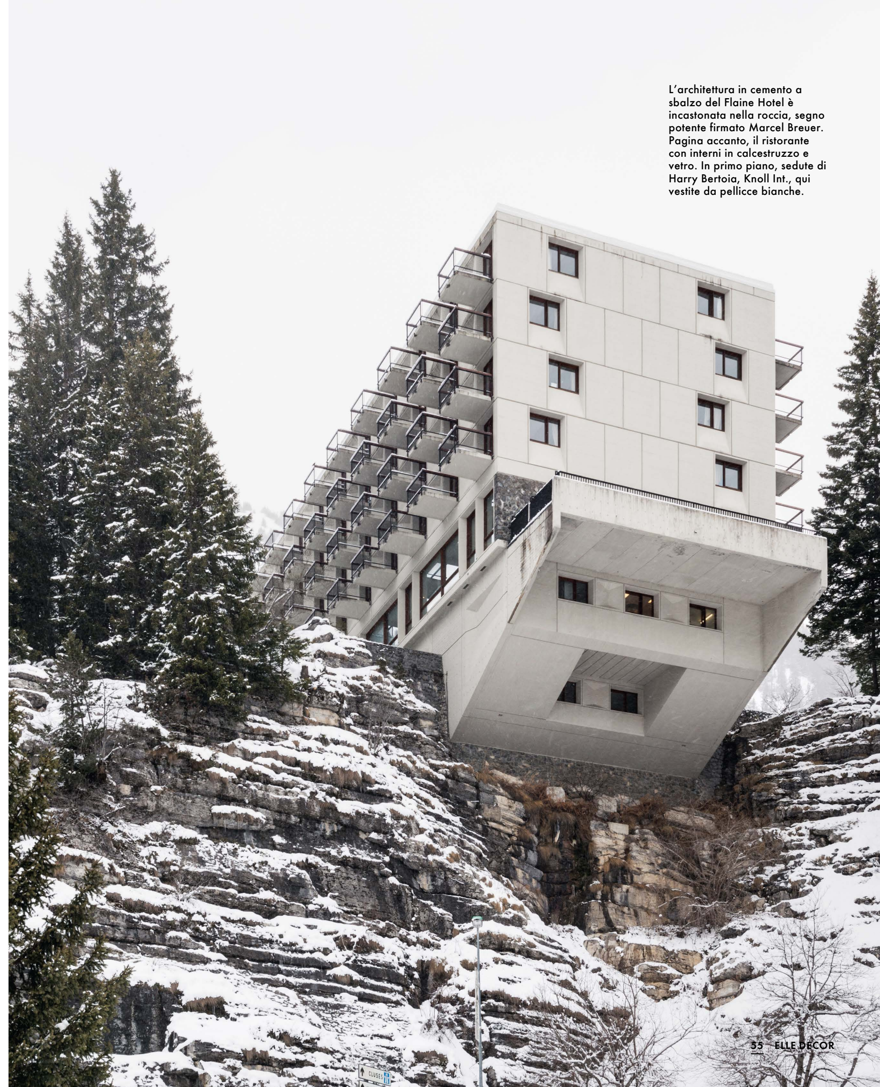
L'architettura in cemento a sbalzo del Flaine Hotel è incastonata nella roccia, segno potente firmato Marcel Breuer. Pagina accanto, il ristorante con interni in calcestruzzo e vetro. In primo piano, sedute di Harry Bertoia, Knoll Int., qui vestite da pellicce bianche.