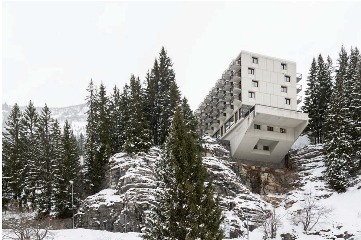
Spektakulärer Überhang: Hotel Le Flaine - 1968 erbaut und 2019 komplett renoviert. • Spectacular: Hotel Le Flaine - built 1968, refurbished 2019

tion that, here in Flaine, landscape, architecture and interiors form a unit. Amazingly calm, cleverly cool façades, confidently structured, lively concrete. One immediately expects - and quite rightly so - flawlessly proportioned interiors where, besides the aching muscles, the spirit as well finds recreation. Bauhaus architect Marcel Breuer and his team did not, as was usually the case, have to obey clueless municipal councils and witless microentrepreneurs but alone the esprit of a cosmopolitan Parisian entrepreneur who was here squandering his great passion - and plenty of money, of course. Here, one immediately also feels: once the skiing season has ended here and the snow has melted, no sad backdrops remain. Spring, summer and autumn also celebrate their calmer feasts in Flaine."