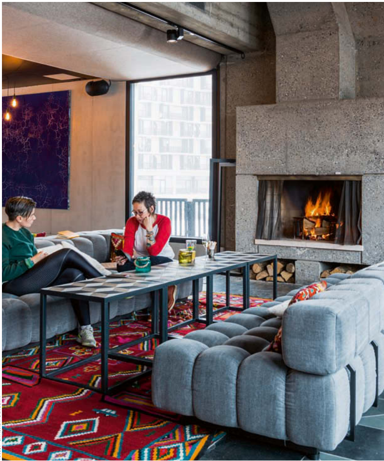
Hotel Terminal Neige - Le Totem nach seinem Make-over durch Guillaume Relier von R Architecture aus Paris