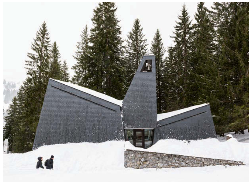
Ökumenische Kapelle von Marcel Breuer - 1973 eingeweiht • Marcel Breuer's chapel - consecrated in 1973