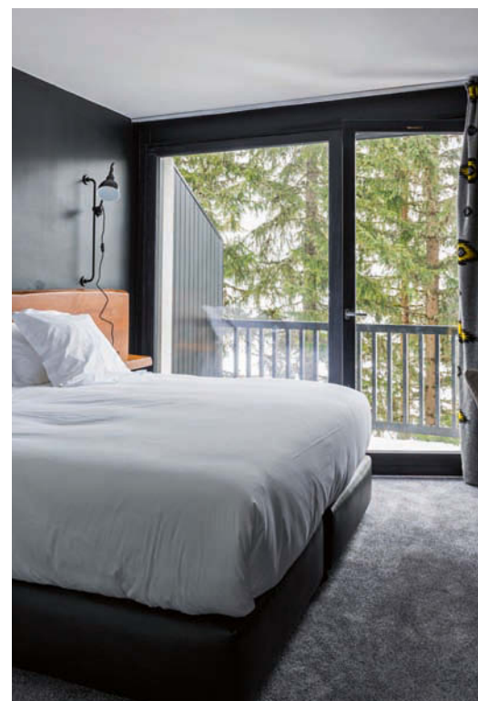
Eine internationale, junge Klientel lockt das Hotel Terminal Neige - Le Totem mit farbenfrohem Vintagemobiliar in denkmalgeschützter Betonhülle. • Hotel Terminal Neige - Le Totem, a listed concrete shell for a young clientele

vermutet sofort - und mit Recht - makellos proportionierte Innenräume, in denen neben den geschundenen Muskeln auch der Geist Raum findet, um zur Recreation zu gelangen. Bauhausarchitekt Marcel Breuer und sein Team hatten nicht, wie sonst üblich, ahnungslosen Gemeinderäten und geistlosen Kleinstunternehmern zu folgen, sondern allein dem Esprit eines weltläufigen Pariser Unternehmers, der hier seine große Passion vergeudete - und viel Geld, versteht sich. Hier fühlt man auch sofort: wenn hier die Skisaison zu Ende und der Schnee verschwunden ist, bleiben keine tristen Kulissen übrig. Frühjahr, Sommer und Herbst feiern auch in Flaine ihre großen stillen Feste."