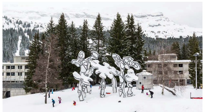
Le Boqueteau des 7 arbres - Skulpturengruppe von Jean Dubuffet • Le Boqueteau des 7 Aarbres - by Jean Dubuffet