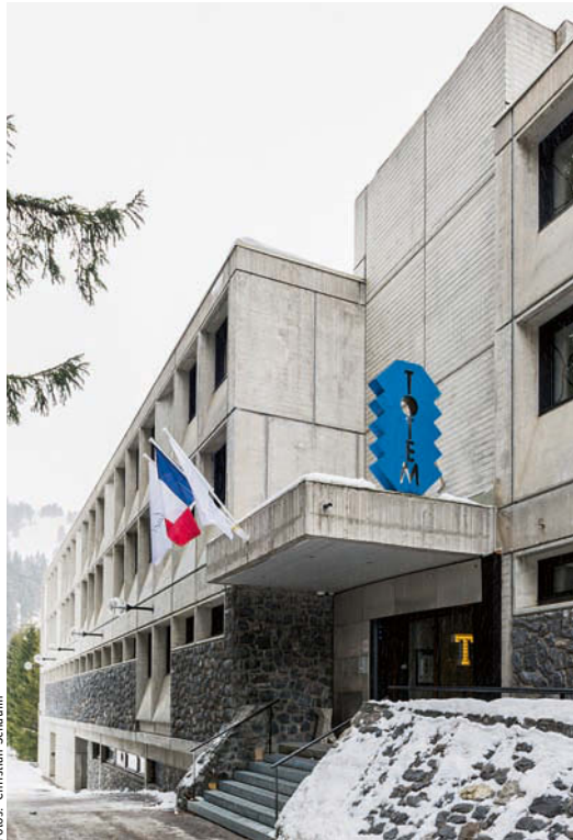
Hotel Terminal Neige - Le Totem • Hotel Terminal Neige - Le Totem