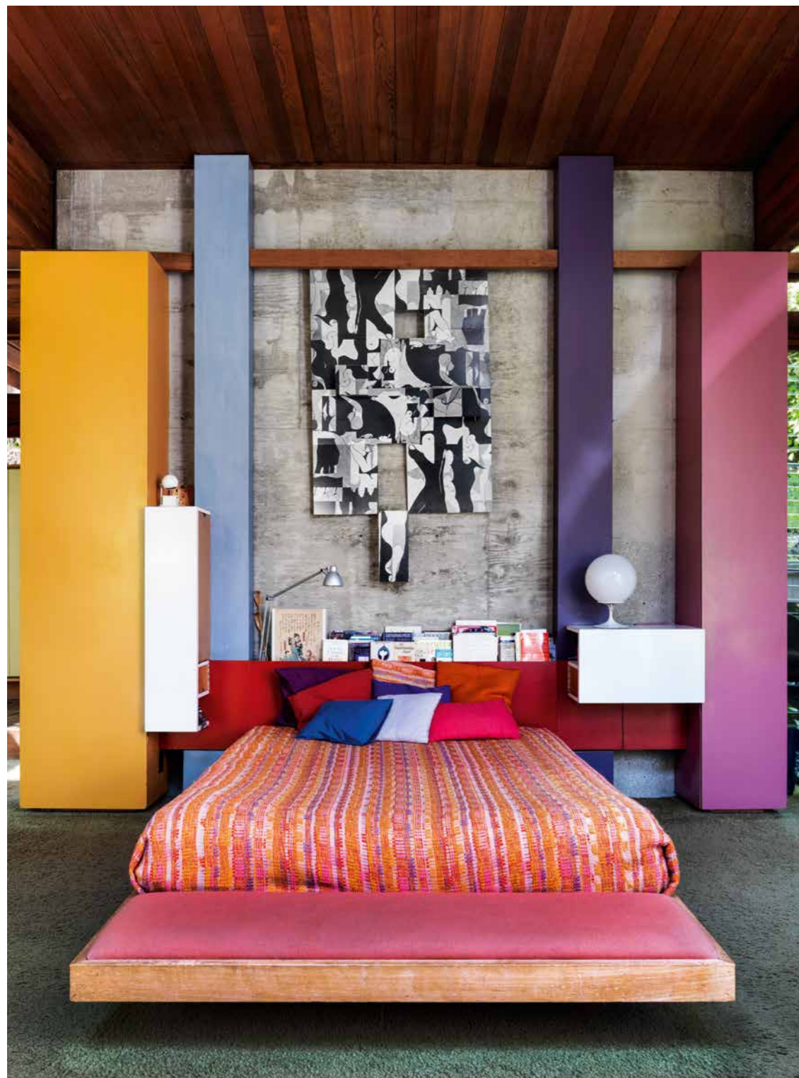
Acima, a suíte máster, onde as cores têm papel preponderante na arquitetura; e, ao lado, um dos banheiros, iluminado por uma generosa claraboia. Na pág. seguinte, acima, o quarto dos filhos, que dormiam em aconchegantes nichos distribuídos em diferentes patamares e estudavam em escrivaninhas voltadas para o verde lá fora; e, abaixo, o arquiteto Ray Kappe